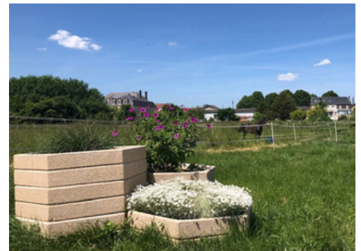
Entrée à Coucy 2 Vivaces : Pennisetum- Géranium Patricia - Corbeille d'argent