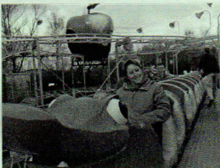
Un bonjour du parc Walygator

Ensuite, toute la petite troupe a pu s'en donner à cœur joie et essayer un maximum de manèges. En effet, en raison d'une fréquentation réduite dans le parc, les files d'attente étaient pratiquement inexistantes ; un vrai bonheur pour les habitués de ce genre de sortie qui sont parfois obligés de patienter plus d'une heure pour pouvoir monter à bord des manèges les plus en vue. Au final, les heureux participants ont vu défiler la journée au même rythme que les manèges à sensation comme